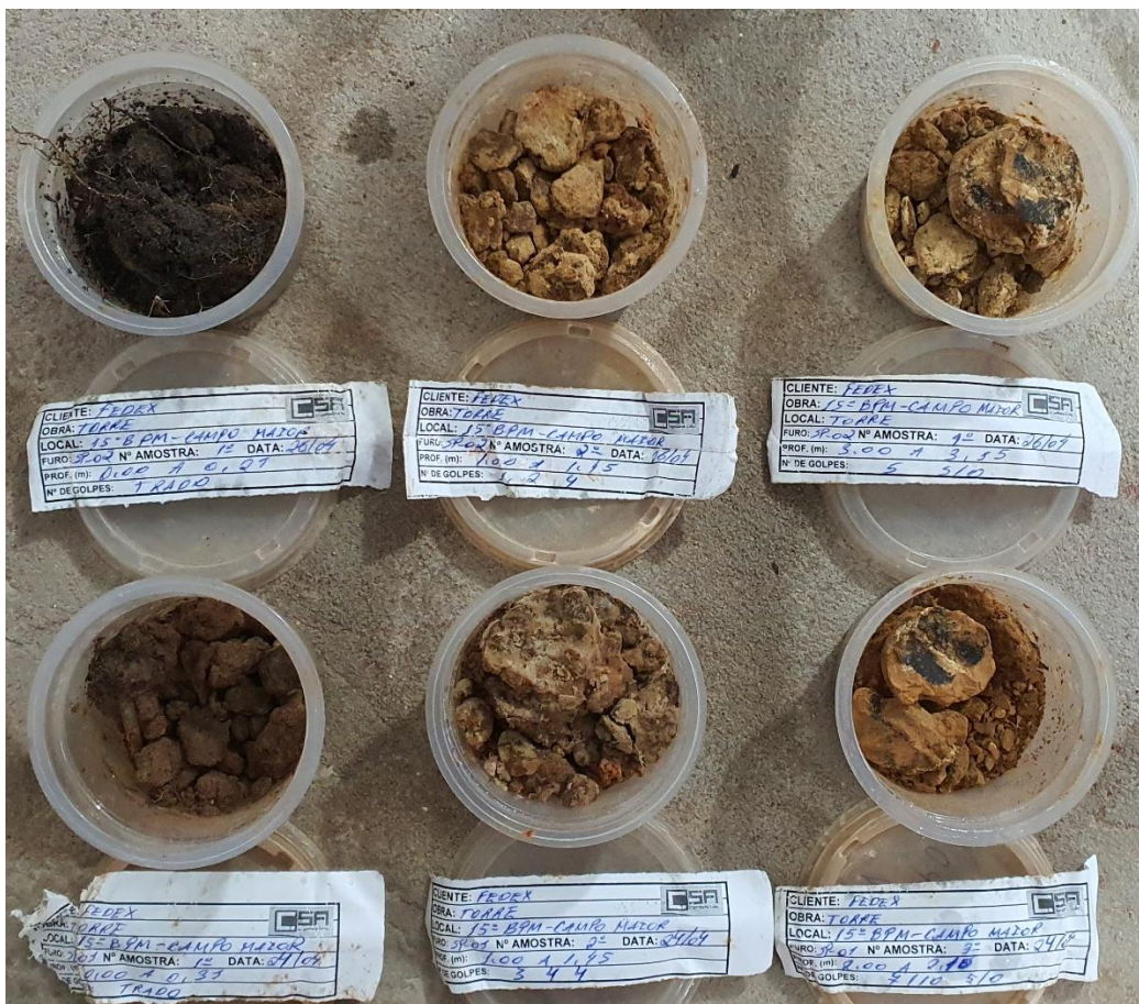
AMOSTRAS REPRESENTATIVAS DOS FUROS: SPT 01 E SPT 02 (VISUALIZAÇÃO: DE BAIXO PARA CIMA /ESQUERDA PARA DIREITA)